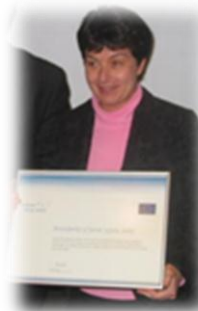
Županja občine Varese Ligure je prejela nagrado eea® v letu 2005

» V občini Varese Ligure smo leta 2005 preizkusili orodje eea® v sklopu projekta EURENA. Lahko rečem, da je orodje eea® naši občini povečalo znanje na področju energetskega načrtovanja in je dobro orodje za vključenost širše javnosti.«